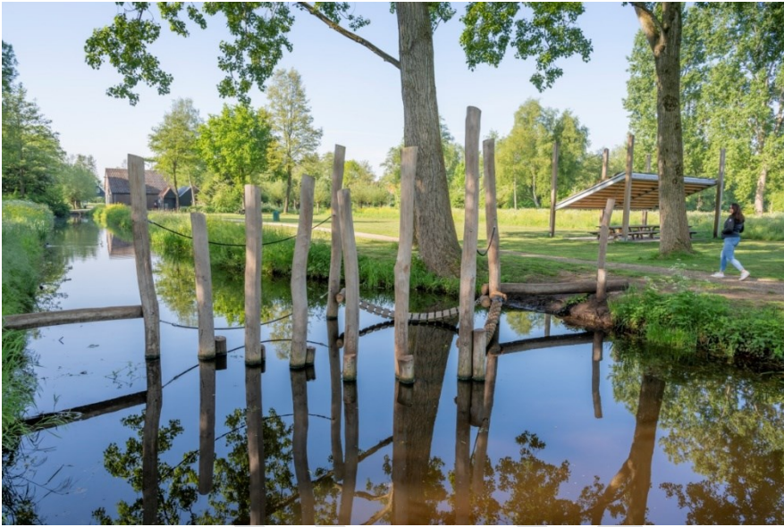
Wandelroute Speelbos met op de achtergrond de Hendrikshoeve

De Hendrikshoeve is een aantrekkelijke locatie voor de recreant door de ligging nabij het kanorouten netwerk en de mountainbikeroute. In het Loetbos zijn verder een speelobject in de vorm van een mol, een speelbos, meerdere parkeerplaatsen, een Toeristisch Overstap Punt, een overdekte picknickplek 'Hoedje van het Loetje', een toiletgebouw, kanocentrum Loetbos en in de toekomst een uitkijktoren te vinden. De accommodatie/locatie heeft de potentie om zich verder te ontwikkelen tot een kwalitatief hoogwaardig gebouw en omgeving.